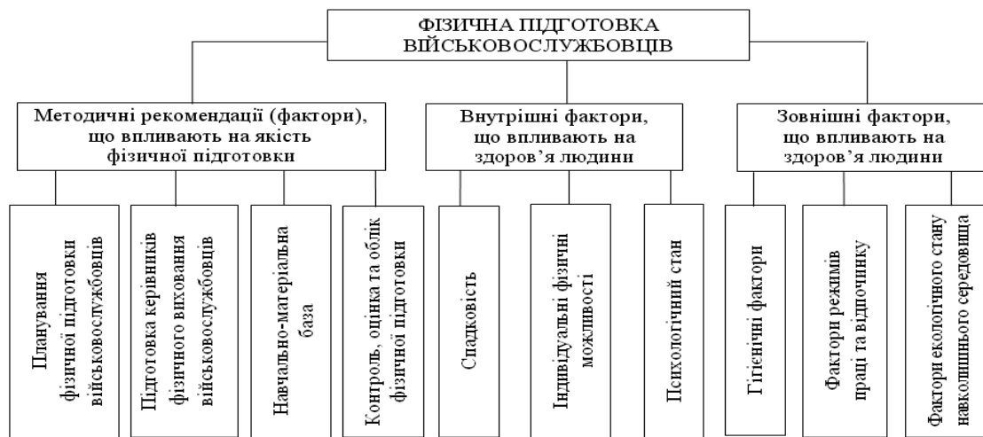
Рис. 1. Фактори, що впливають на якість фізичної підготовки військовослужбовців

Без забезпечення належного рівня здоров'я майбутніх військовослужбовців не можна вести мову про їх ефективну фізичну підготовку. Здоров'я – це правильна, нормальна діяльність організму, його повне фізичне та психічне благополуччя [2]. Здоров'я залежить від наступних показників: спадковості, психологічного стану, факторів екологічного стану навколишнього середовища, режиму та праці та ін.