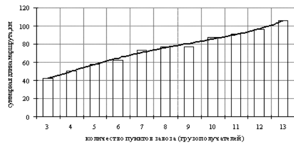
Рис. 3. Зависимость суммарной длины маршрутов от количества пунктов завоза груза (грузополучатели)

Основные характеристики, полученные при использовании расчетов на ПК, приведены в табл. 1. При увеличении грузоподъемности автомобиля и количества пунктов завоза груза (грузополучателей) суммарная длина маршрутов соответственно уменьшается и увеличивается согласно полиномиальным кривым шестого порядка.