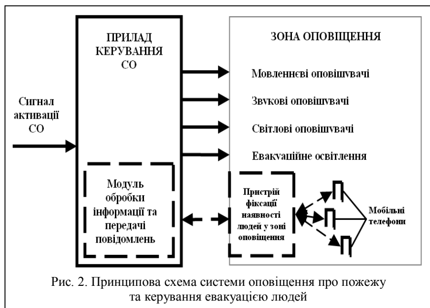
Рис. 2. Принципова схема системи оповіщення про пожежу та керування евакуацією людей

На менш важливу особливість вказаної СО є те, що під час пожежі в будинку одночасно з опові-