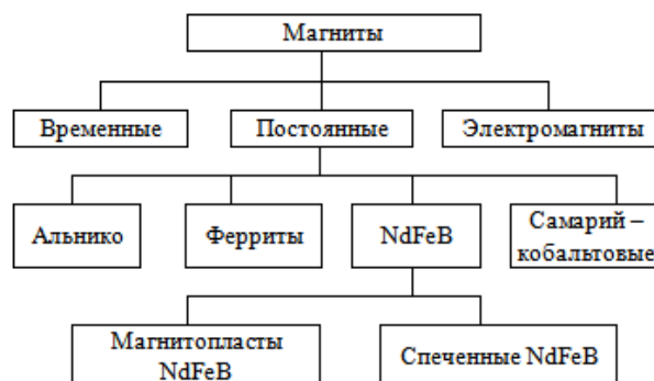
Рис. 2. Классификация магнитов

Существует 4 класса современных наиболее используемых магнитов, каждый из которых базируется на своем составе используемых материалов. Внутри каждого класса различают семейства со своими магнитными свойствами. Эти основные классы следующие: неодим – железо – бор (Nd-Fe-B, NdFeB, NIB); кобальт самария (Sm-Co); керамические (ферриты). альнико (Alnico). Краткая классификация магнитов представлена на рис. 2