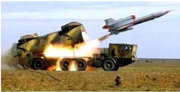
Рис. 1. Пуск БпЛА ВР-3 "Рейс"

Постановка проблеми. Збройні сили України, зокрема їх Сухопутні війська ще знаходяться на стадії їх розбудови та реформування. За роки незалежності України питання оснащення їх сучасними безпілотними авіаційними комплексами (БпАК) підіймалось неодноразово й на різних рівнях, але до цього часу воно залишається невирішеним, хоча без БпАК сьогодні не обходиться жодна армія, не кажучи вже про армії провідних країн світу. Безпілотні авіаційні комплекси ВР-3 "Рейс" (рис. 1) та ВР-2 "Стриж" (рис. 2), що є на озброєнні ЗС України, призначені для ведення повітряної розвідки в інтересах різних видів Збройних сил, переважно в умовах, де використання пілотованих літаків пов'язано з великим ризиком їх втрати та невідне за критерієм "вартість-ефективність".