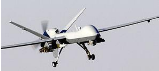
Рис. 6. MQ-9 Reaper в польоті

Про пріоритетне застосування безпілотних авіаційних комплексів в армії США може свідчити той факт, що пілоти БПЛА і, у тому числі оператори корисного навантаження, з січня поточного року отримують льотні виплати.