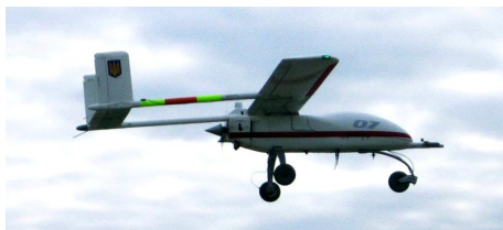
Рис. 7. БПЛА "Стрепет"

Суттєвих досягнень у цьому напрямку досягнуто в ДП МО України "ЧАРЗ". За відносно короткий час "ЧАРЗ" вдалося перейти від конструкторської ідеї до створення необхідної документації, розробки автономного технологічного циклу серії БПЛА. На базі спеціально створеної виробничої дільниці вдалося реалізувати проект з виготовлення БПЛА за версією "Стрепет-Л" ("легкий" – із злітною масою 80 кг і корисним навантаженням 20 кг), "Стрепет-С" ("середній" із злітною масою 200 кг, корисним навантаженням 50 кг) (рис. 7).