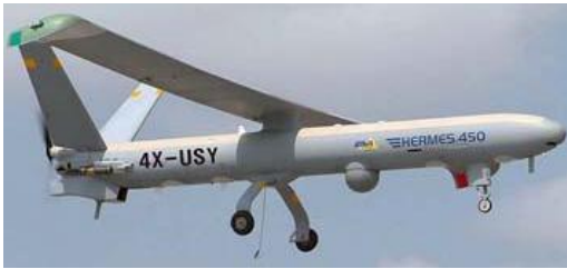
Рис. 5. Багатоцільовий розвідувальний БПЛА