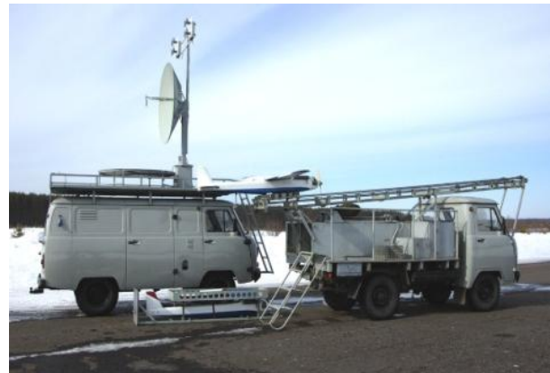
Рис. 8. БПЛА "Кажан"

ТзОВ НПП "Укртехно-Атом" (м. Київ) представляє БПЛА "Кажан" (рис. 8), який значною мірою відповідає уніфікованим оперативно-тактичним вимогам до БПЛА.