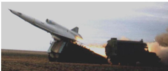
Рис. 2. Пуск БпЛА оперативно-тактичного призначення ВР-2 "Стриж"

Такі умови характерні для тактичної зони та найближчої оперативної глибини території противника, що найбільш насичені засобами ППО.