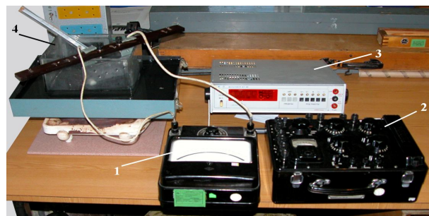
Рис. 1. Обладнання, застосоване при проведенні експерименту

Загальний вид обладнання, застосованого при проведенні експерименту наведено на рис. 1.