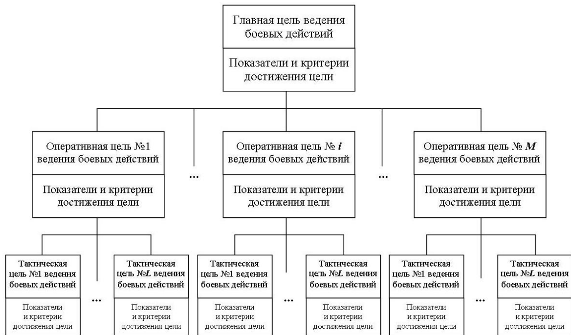
Рис. 1. Проектируемое в системе управления дерево целей для формирования одного из вариантов замысла ведения боевых действий

Информационная подсистема представляет собой совокупность источников информации, средств получения, передачи, хранения, обработки и выдачи данных для добывания информации [2, 5]. В частном случае к понятию «информации» нужно отнести ту разность между измеренным и требуемым значением показателя эффективности деятельности организации, а также те значения параметров, которые нужно сформировать и выдать объектам управления для достижения требуемого результата.