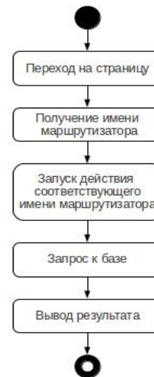
Рис. 1. Диаграмма состояний алгоритма поиска

Для избежания вышеперечисленных проблем, в данном веб-сервисе используется поиск, который ищет вхождения слова или словосочетания из поискового запроса, в соответствии с разделом сайта на котором находится пользователь (рис. 1), т.е. когда пользователь находится на страницах каталога, то вхождения поискового запроса ищется в рамках текущего каталога, если же пользователь находится, к примеру, на странице списка пользователей веб-сервиса, то поиск будет производиться по именам и фамилиям зарегистрированных пользователей.