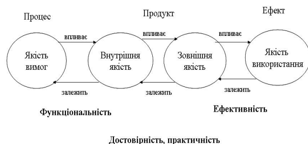
Рис. 1. Модель якості СППР

Всі перелічені показники характеризують якість СППР. Розрізняють зовнішню та внутрішню якість. Зовнішня якість СППР – це сукупність характеристик для зовнішнього представлення, які можуть бути оцінені під час тестування (використання). Внутрішня якість – це сукупність характеристик СППР для внутрішнього представлення. Модель якості СППР яка показує взаємозв'язок внутрішньої та зовнішньої якості представлена на рис. 1.