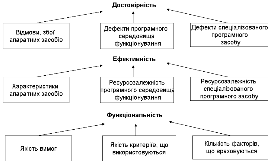
Рис. 2. Вплив факторів на якість СППР

СППР, яка буде реалізовувати потрібну кількість функцій, але мати малу достовірність результатів. Або, навпаки, забезпечувати потрібну достовірність при реалізації малої кількості функцій (мати низьку функціональність). Таким чином, при створенні СППР великого об'єму, які реалізують велику кількість функцій, для забезпечення високої достовірності доцільно здійснювати декомпозицію програми на окремі програмні модулі меншого об'єму.