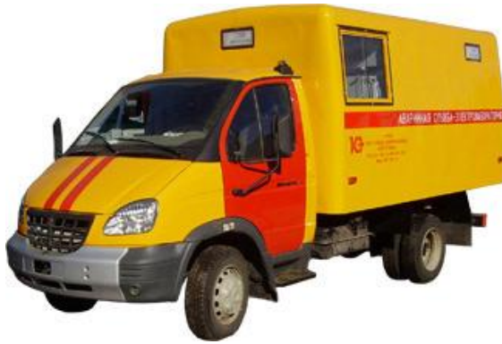
Рис. 1. Пересувна лабораторія вимірювальної техніки МНС України

не враховується можливість зміни укомплектованості ЛВТ на кожен день робіт, швидкості їх пересування, дійсного фонду робочого часу на одного спеціаліста та часу, необхідного на обладнання робочого місця при кожному пересуванні.