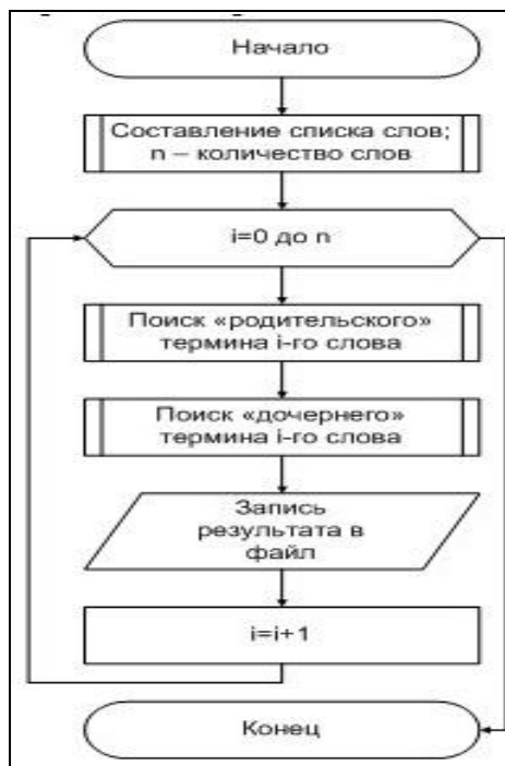
Рис. 3. Обобщенная блок-схема алгоритма работы программы

Обобщенная блок-схема алгоритма работы программы «Интерпретатор иерархических связей» приведена на рис. 3.