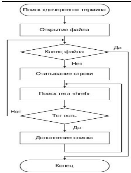
Рис. 2. Блок-схема алгоритма создания «дочернего» списка

Созданные списки терминов при помощи html-тегов формируют интерактивную таблицу иерархических связей.