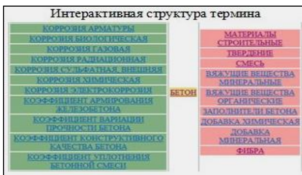
Рис. 5. Пример работы программы «Интерпретатор иерархических связей» для термина «Бетон»

Пример работы программы «Интерпретатор иерархических связей» для термина «Бетон» приведен на рис. 5.