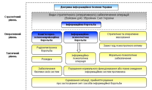
Рис. 1. Складові системи ІБ ЗС України

інформаційні процеси в системах іншої сторони. Застосування соціальних мереж слід віднести до таких складових ІБ як комп'ютерно-телекомунікаційна та інформаційно-психологічна боротьба (рис. 1) [3, 6].