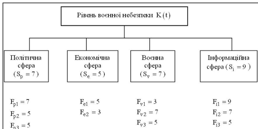
Рис. 1. Гіпотетичний приклад оцінювання рівня воєнної небезпеки

Процедуру обґрунтування завдань розглянемо на гіпотетичному прикладі усунення або нейтралізації загроз воєнного характеру з боку евентуального противника. Для наглядності трирівнева ієрархія оцінювання рівня воєнної небезпеки містить політичну ( S_p ), економічну ( S_e ), воєнну ( S_v ) і інформаційну ( S_i ) сфери (рис. 1).