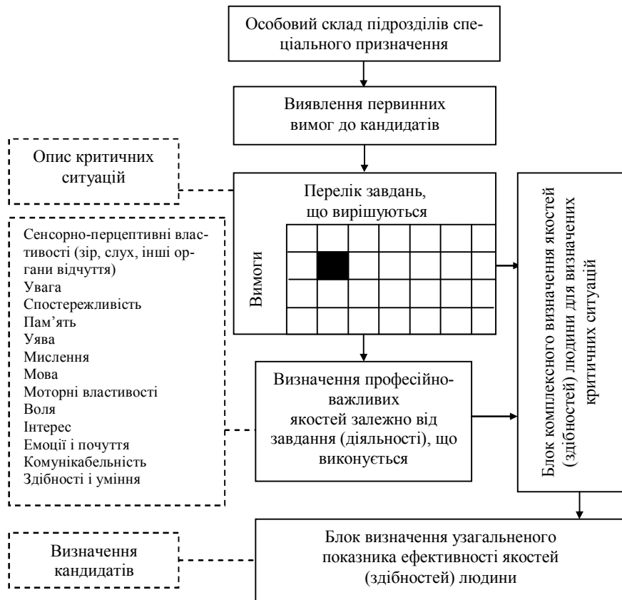
Рис. 1. Структура процесу комплексного дослідження психофізичних особливостей людини

Проте ряд динамічних ознак може виявлятися лише в критичній ситуації. Для визначення даних ознак необхідно помістити людину в схожі ситуації в процесі підготовки або спрогнозувати їх на підставі інших ознак. Роль технічних засобів знімання інформації, що дозволяють дистанційно аналізувати дії того, якого випробують, тут надто важлива. При цьому пристрої знімання інформації повинні виявляти і проводити біометрію на відстанях в десятки метрів (залежно від завдання, яке вирішується), бути не критичні до положення тіла і голови відносно них, до наявності головних уборів, окулярів і інших засобів екіпіровки. Крім того, в алгоритм обробки мають бути закладені механізми виявлення і класифікації ненормальних дій людини в тій або іншій ситуації.