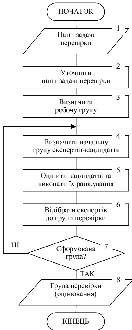
Рис. 2. Узагальнений алгоритм призначення групи перевірки (оцінювання)

Для визначення числа експертів використовуємо: