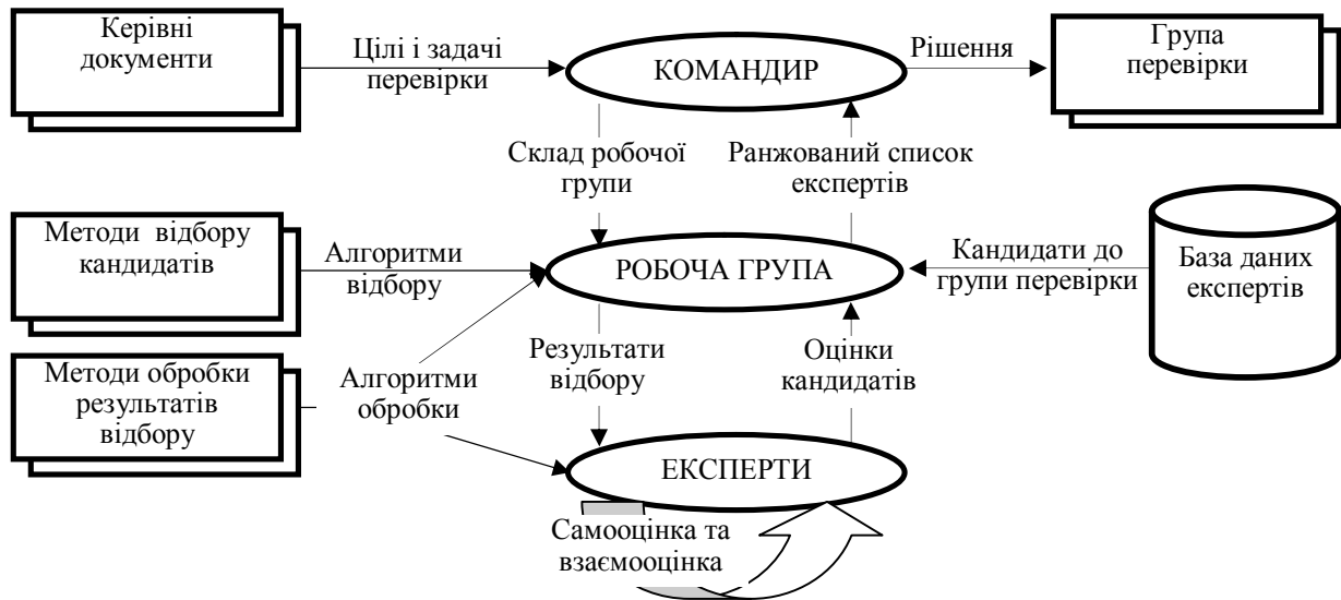
Рис. 1. Модель процесу призначення групи перевірки (оцінювання)

вання експертних груп оцінювання персоналу та керівних документів з організації і проведення перевірок та оцінювання особового складу військових організаційних структур.