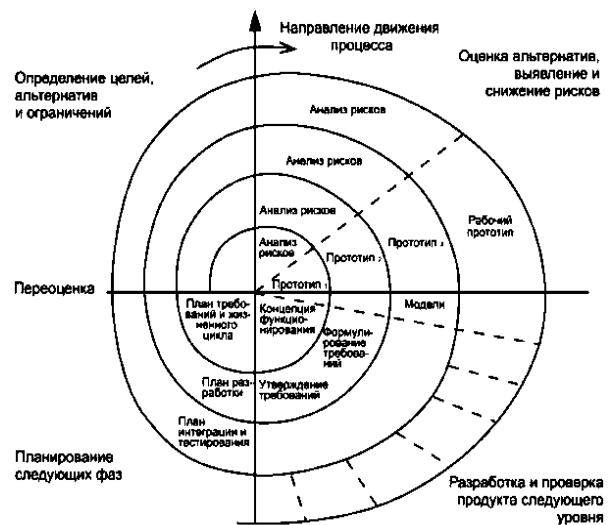
Рис. 1. Спиральная модель Боэма

Таким образом, модель Боэма можно рассматривать в качестве инструмента поддержки управления мультипроектом создания СТС. В качестве недостатка модели с точки зрения управления процессом разработки следует указать на то, что она, как и любая раскручивающаяся спираль, плохо отображает временные соотношения между сроками выполнения работ на разных витках.