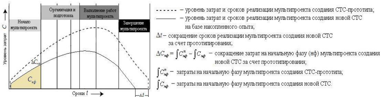
Рис. 2. Сокращение затрат и сроков реализации мультипроекта создания СТС за счет прототипирования

Распределение затрат на протяжении ЖЦ проекта, представленное на рис. 2 взято за основу при создании винтовой модели ЖЦ проекта.