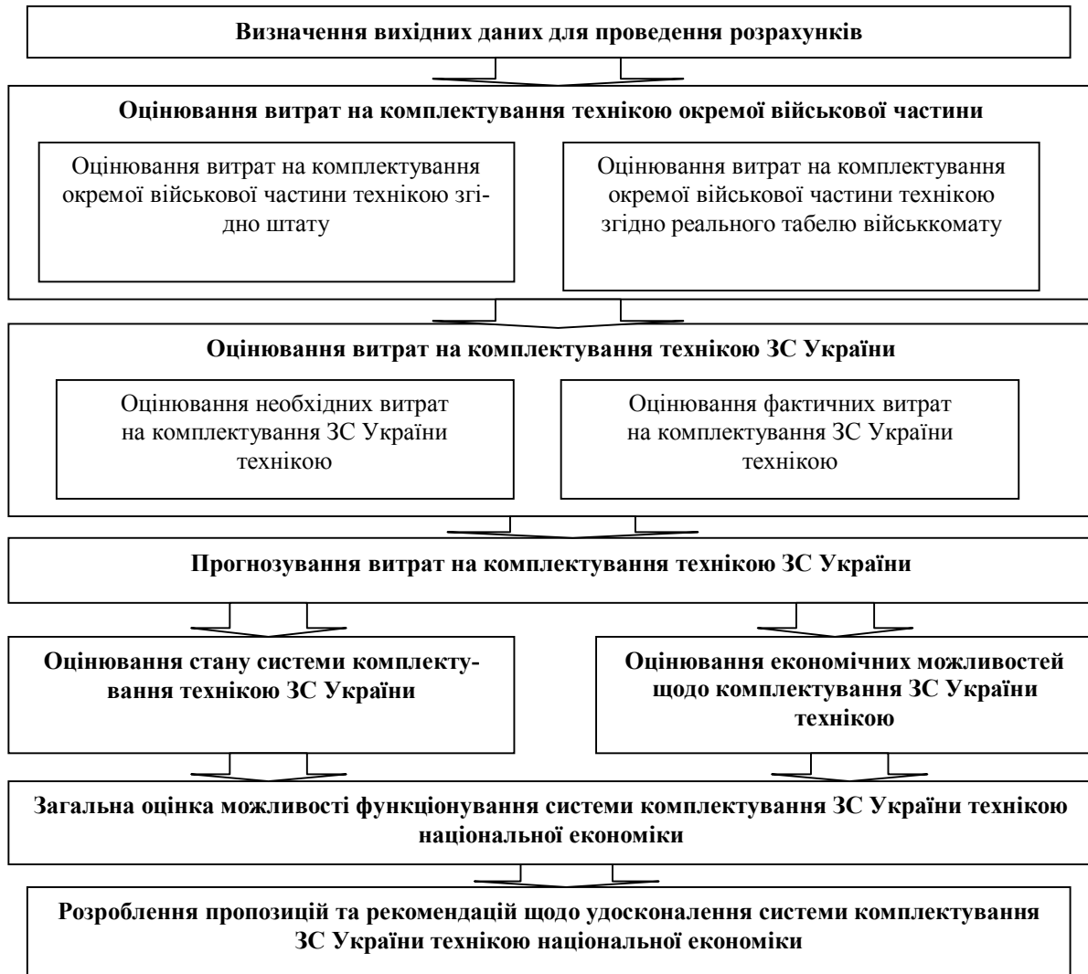
Рис. 1. Порядок оцінювання стану системи комплектування ЗС України технікою національної економіки

З метою з'ясування спроможності держави щодо підтримування у належному стані системи комплектування ЗС України технікою національної економіки необхідно оцінити стан самої системи, визначити економічні можливості держави щодо забезпечення її функціонування на момент оцінювання, а також з метою коректного корегування визначених показників спрогнозувати витрати на наступний період її функціонування. Тобто в загальному вигляді, порядок оцінювання стану системи комплектування ЗС України можна представити як на рис. 1.