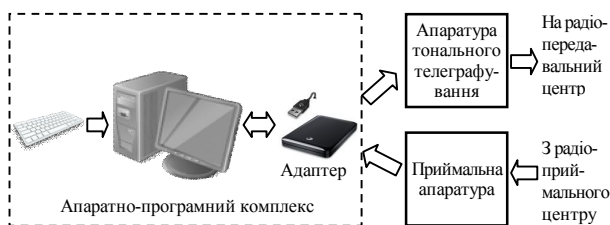
Рис. 1. Схема взаємодії апаратно-програмного комплексу з апаратурою командного пункту

Пропонується наступна схема взаємодії АПК з апаратурою КП (рис. 1).