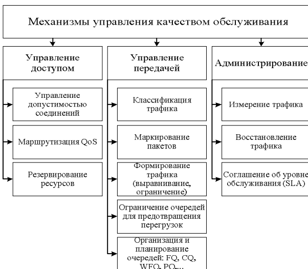
Рис. 1. Классификация механизмов управления качеством обслуживания

На рис. 1. представлена классификация механизмов управления качеством обслуживания на основе рекомендаций международного союза электросвязи МСЭ-Т У.1291.