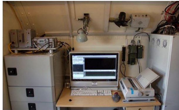
Рис. 2. Рабочее место оператора