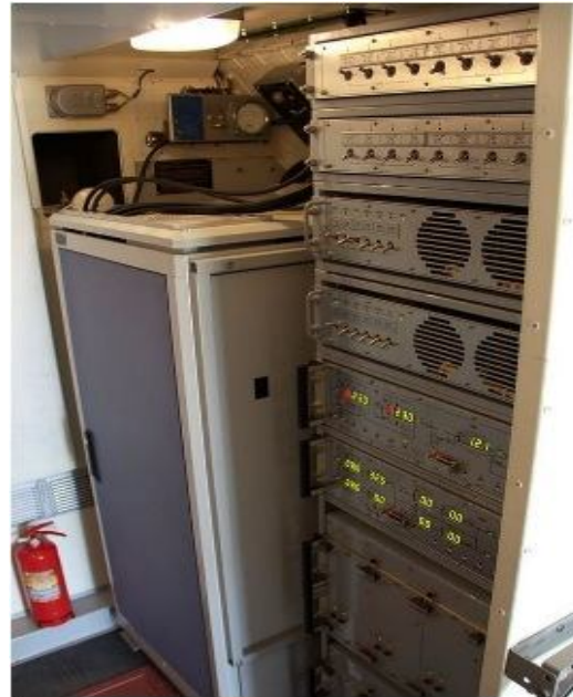
Рис. 3. Аппаратура станции РЕБ «Красуха-4»