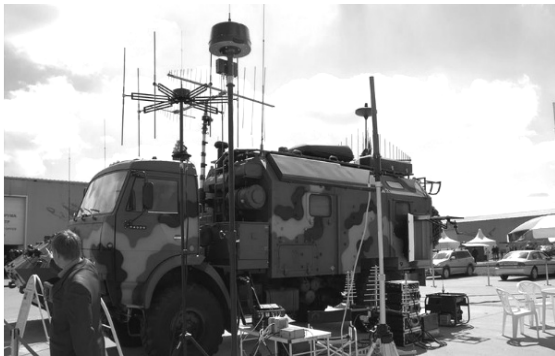
Рис. 1. Станция РЕБ «Красуха-4»

1. Комплекс «Шиповник Аэро» (рис. 1) представляет собой многоцелевой комплекс, который по замыслу разработчиков, позволяет захватить бесплотный аппарат, даже не зная шифров и кодов канала управления. Стоит отметить, что данный комплекс в 2015 году был «потерян» российскими спецслужбами и «случайно найден» подразделением ВСУ на территории Донбасса.