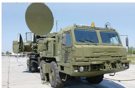
Рис. 5. Станция РЕБ “Красуха-4”

2. Станция “Красуха-4” предназначена для прикрытия войск и обширных территорий от радиолокационного обнаружения, а также противодействия самолетам ДРЛОиУ и БПЛА противника (рис. 5) [2].