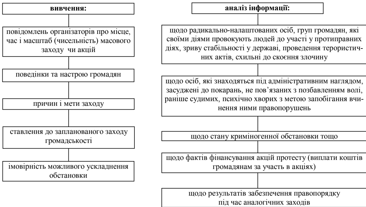
Рис. 1. Порядок роботи керівного складу ГУМВС, УМВС, міськрайлінорганів щодо вивчення ситуації та надання звітності

9. Загальна кількість працівників міліції, військовослужбовців НГУ, які залучаються для забезпечення охорони громадського порядку.