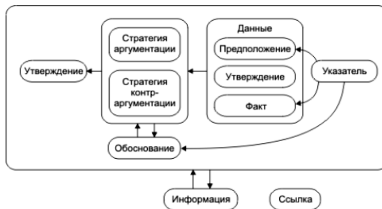
Рис. 1. Структура модели аргумента Trust-IT

Структура модели аргумента Trust-IT показана на рис. 1 [8, 16].