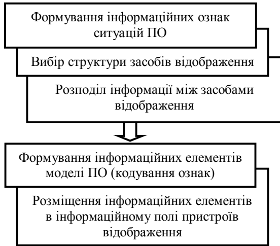
Рис. 1 Склад часткових задач відбору інформаційних ознак для формування моделі ПО

ніше подібне завдання стосовно формування ІМ формально не вирішувалося. Зазвичай розробники систем відображення використовують свій досвід і досвід практичного застосування АСУ СП.