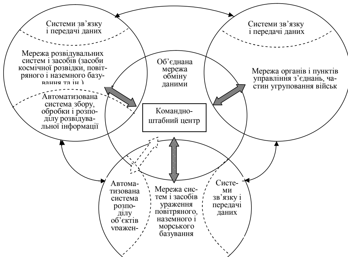
Рис. 1. Загальна схема мережевої взаємодії сил і засобів при веденні воєнних (бойових) дій

Функціональною відмінністю й властивістю концепції мережецентричної війни є безперервність і гнучкість оперативного і бойового управління операцією бойовими діями на всіх рівнях, а також здатність оперативно адаптуватися до динамічної обстановки і переносити функції оперативного та бойового управління на будь-який рівень по вертикалі й горизонталі відповідно до виникаючих потреб оперативного планування й управління силами на просторі війни [4]. Досягнення перелічених властивостей насамперед обумовлюється ієрархією структури системи управління угрупованням військ (сил).