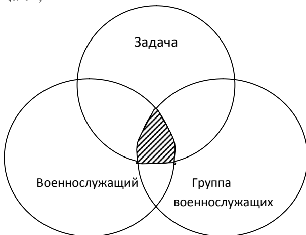
Рис. 3. Диаграмма Венна (модель трех кругов)

в котром пересікаються все три окружности. Работая над решением поставленной задачи, члены команды стремятся к этой цели ради успеха всей команды, одновременно развиваясь как личность в её составе. Для того чтобы достичь гармоничного сосуществования трех рассматриваемых элементов, необходимо представить роль военного менеджера в команде, поставив его на место лидера, а скорее всего на место подчиненного, работающего во имя общей цели. Функция военного менеджера – поддерживать целостность команды и её боевой дух. Задача команды – реализовывать задуманное. Военный менеджер выполняет свою функцию, действуя от имени и по поручению остальных членов команды, не отдавая им приказов и распоряжений. Однако военному менеджеру следует помнить главное (если вы возглавляете команду, а не просто группу из нескольких военнослужащих) о вас будут судить другие (члены вашей команды, вышестоящие начальники и коллеги) не по вашим персональным достижениям, а по результатам деятельности команды в целом;