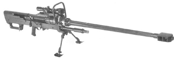
Рис. 3. 20-мм великокаліберна снайперська гвинтівка «Mechem» NTW-20 (ЮАР)

Наступною реалізованою схемою є схема аналогічна побудові артилерійських гармат, яка включає в свій склад противідкотний пристрій. Прикладом такої конструктивної схеми може бути 20 мм снайперська гвинтівка «Mechem» NTW-20 (рис. 3).