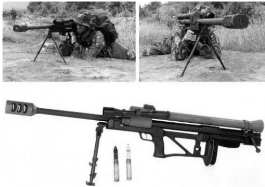
Рис. 2. 20-мм великокаліберна снайперська гвинтівка RT-20

Прийняття вказаних мір по зниженню впливу віддачі пострілу на стрілка зброю досягнувши межі калібру 15,5 мм вичерпала можливості використання більш потужних боєприпасів [2].