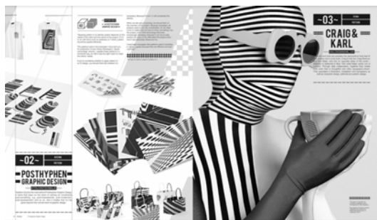
Рис. 2. Приклад розвороту квітневого номеру журналу «IdN»

Стиль не обмежує у виборі колірної гами, але, по праву, найпопулярнішими вважаються червоний, жовтий і яскраво-синій кольори. У виданні майстерно поєднуються контрастні кольори, і яскраво насичені відтінки прекрасно уживаються з пастельними і білими тонами.