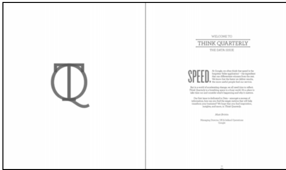
Рис. 1. Приклад розвороту жовтневого номеру журналу «Think Quarterly»

в середині тексту, або кольорова буквица — все виглядає максимально гармонійно та легко [13].