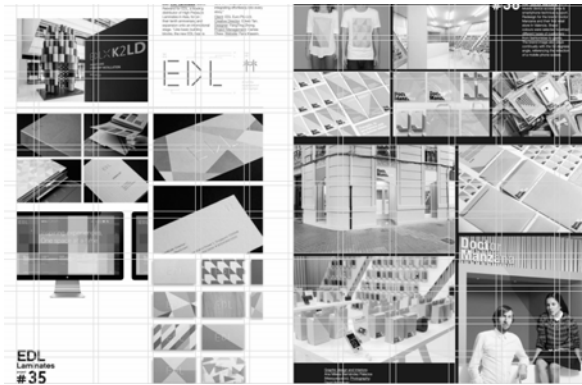
Рис. 3. Модульна сітка розвороту квітневого номеру журналу «IdN»

ім власним шляхом, вибираючи між чіткими лініями і лаконічністю, або ж продуманим і спланованим хаосом на розвороті.