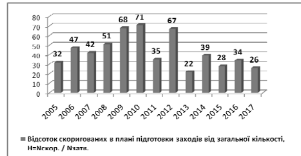
Рис. 5. Рівень коригування обсягів планів підготовки ЗС України за напрямом «Бойова підготовка»

Тому метою статті є розроблення методики розподілу обмеженого фінансового ресурсу в планах підготовки ЗС України за напрямом – бойова підготовка з урахуванням рівнів навченості особового складу частин, ефективності виконання планів підготовки за минулий період та коефіцієнту вкладу кожної частини в загальний рівень навченості виду ЗС України (далі – Методика розподілу) (рис. 6).