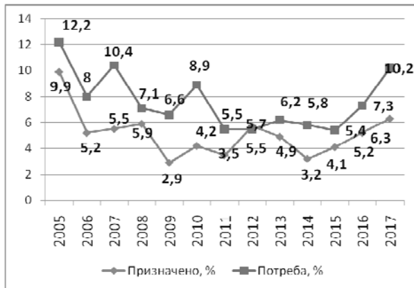
Рис. 1. Рівень потреб та фактичного фінансування підготовки ЗС України в період 2005–2017 рр. (% від загального обсягу фінансування ЗС України)

характеризується значними обсягами їх коригування у ході їх виконання (рис. 5)).