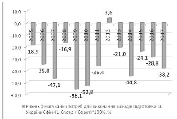
Рис. 2. Рівень недофінансування заходів бойової підготовки ЗС України в період 2005–2017 рр.