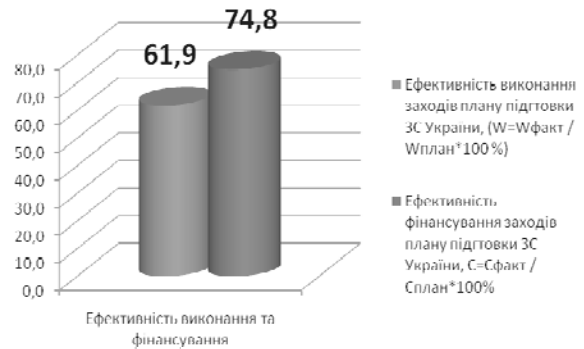
Рис. 4. Середній показник розбіжностей між рівнями фінансування та виконання планів підготовки ЗС України в період 2005–2017 рр.

низька ефективність використання коштів, обумовлена не урахуванням пріоритетності та рівня навченості особового складу з'єднань, частин, підрозділів під час розподілу коштів на заходи підготовки у разі невідповідності виділених ресурсів потребам щодо підготовки ЗС України.