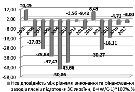
Рис. 3. Розбіжності між рівнями фінансування та виконання планів підготовки ЗС України в період 2005–2017 рр.

Проведений аналіз ефективності виконання та фінансування заходів планів підготовки ЗС України за напрямом «Бойова підготовка» показав, що: