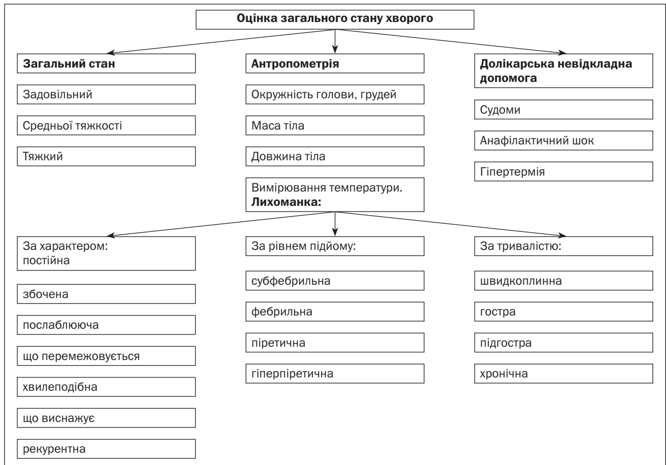
Рисунок 2. Граф логічної структури теми «Оцінка загального стану хворого»

тини для запобігання травмуванню очного яблука при закапуванні крапель в очі?