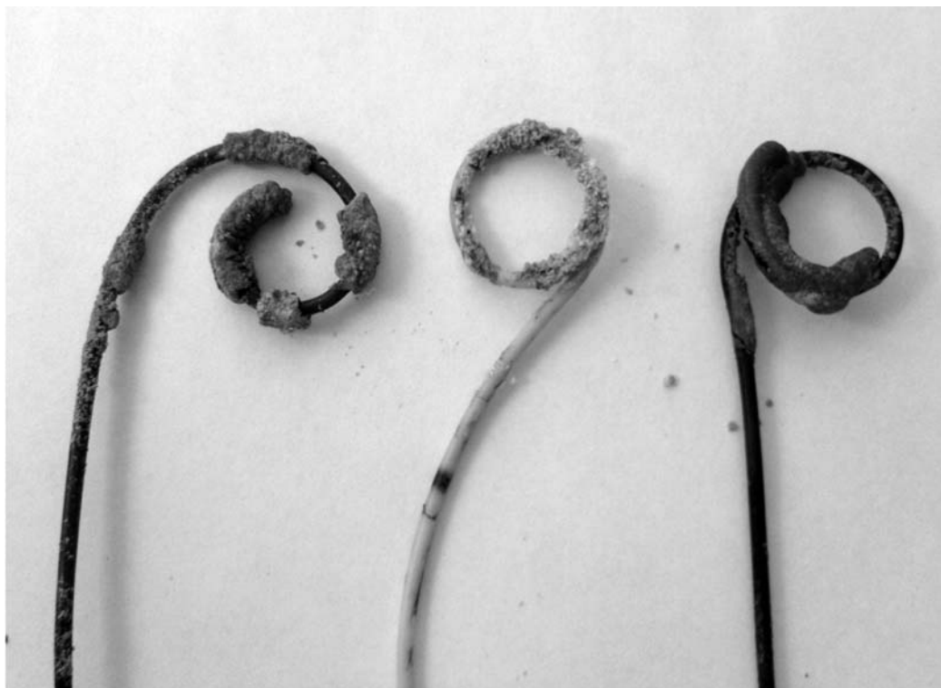
Стенти, інкрустовані солями

У хворих групи порівняння протягом першого місяця спостереження також не виявляли порушення функції дре-