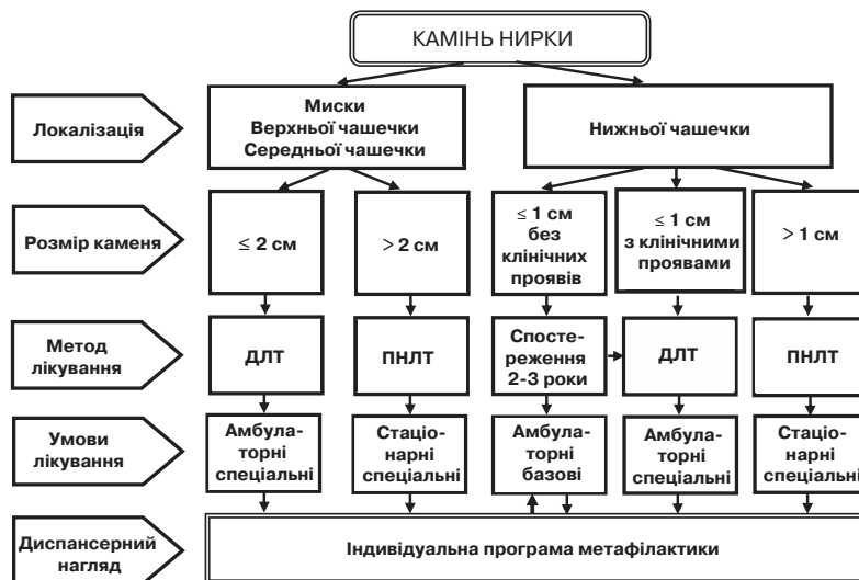
Мал. 2. Алгоритм лікування хворих із каменями нирок

Таким пацієнтам слід організувати ургентну консультацію уролога. Крім базових обстежень їм ще визначають показники коагулограми, електролітів і сечової кислоти крові, роблять посів сечі на флору та чутливість до антибіотиків. У разі труднощів діагностики потрібно також забезпечити проведення комп'ютерної томографії нирок і сечоводів.