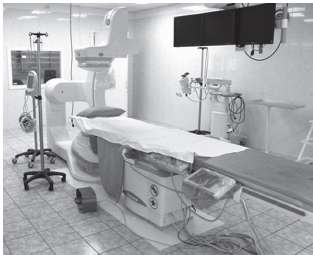
Мал. 1. Ангіограф Innova IQ 2100

Під рентгенологічним контролем у положенні лежачи на спині через інтрад'юсер 6 Фр катетер Кобра введено у праву