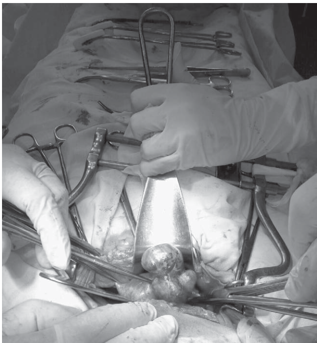
Рис. 1. Интраоперационно выявленные изменения – кистозное образование матки

клетки, пищеварительного тракта, УЗИ органов брюшной полости – патологии не выявлено. При исследовании онкомаркеров изменений не выявлено: СА-125 – 15,72 ЕД/мл, НЕ-4 – 56,5 пмоль/л.