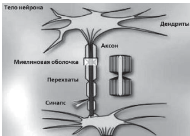
Рис. 1. Нейрон и синапс. Нарушение целостности миелиновой оболочки

правленной на усиление созревания и пролиферации клеток предшественников эритроидного ряда [2, 4, 5, 8, 10, 15, 17].