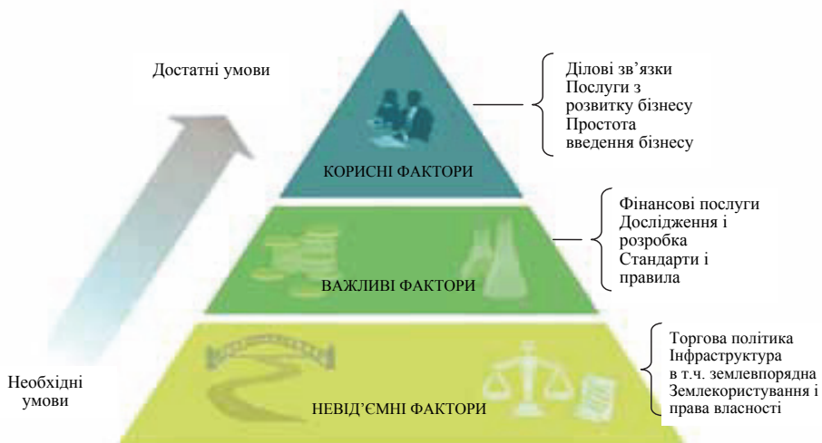
Рисунок 3. Ієрархія факторів підвищення ефективності агробізнесу

В умовах нових земельних відносин моделювання майбутнього інтенсивного використання земель та інших природних ресурсів обумовлює необхідність узгодження інтересів держави, територіальної громади, громадян та юридичних осіб. В Німеччині таке узгодження інтересів здійснюється в результаті розроблення двох видів планів: плану використання земель – як носія публічних потреб та громадськості і плану забудови – як носія фахового містобудівного планування забудови (рис. 4). План використання земель розробляється з виділення типів (підтипів) міського землекористування та визначенням регламентів використання і охорони земель і інших природних ресурсів, а також територій історико-культурної та іншої спадщини. Такий план є обов'язковим для органів управління. План забудови розробляється із врахуванням правового статусу земельних ділянок їх власників і є обов'язковим для всіх: органів влади, громадян та юридичних осіб.