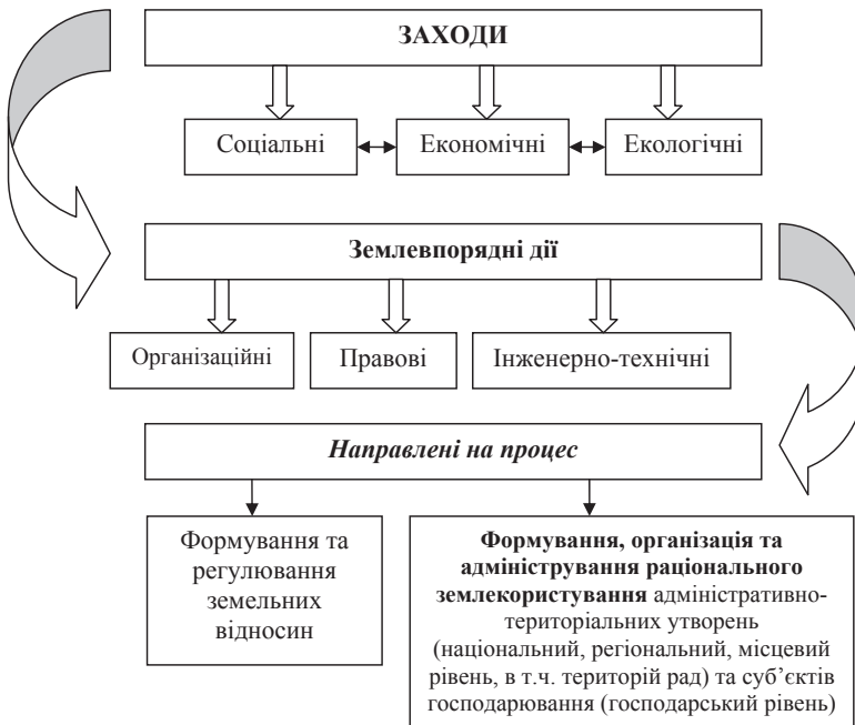
Рисунок 5. Логічно смислова модель сутності сучасного землеустрою