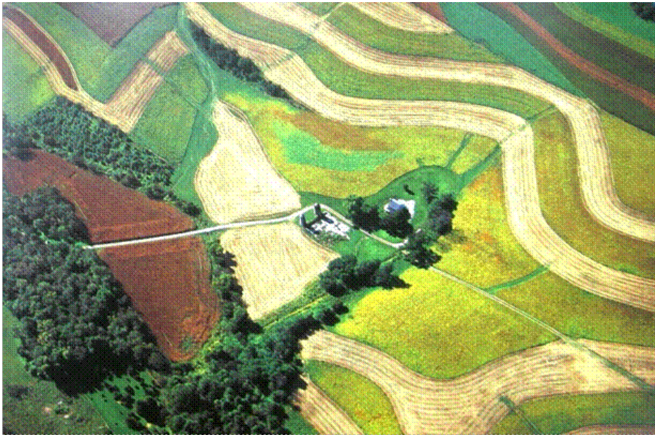
Рисунок 2. Фрагмент контурно-меліоративної організації території в США

Згідно досліджень ФАО щодо впливу факторів на аграрну економіку, зарубіжними вченими зроблено висновок, що для створення сприятливих умов ефективного розвитку конкурентних агропромислових підприємств – всі фактори впливу розподіляються по важливості. Зокрема, вони поділяються в порядку їх значимості на необхідні, важливі і корисні (рис. 3) [3, 8]. Відповідно землевпорядкування, землекористування сільськогосподарських підприємств є невід’ємним фактором їх економіки та капіталізації землекористування.