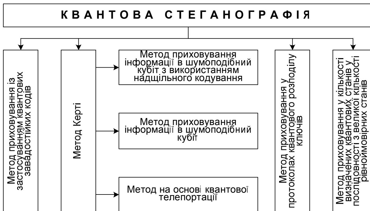
Рис.2. Методи квантової стеганографії

Запропонована класифікація методів квантової стеганографії зображена на рис.2: