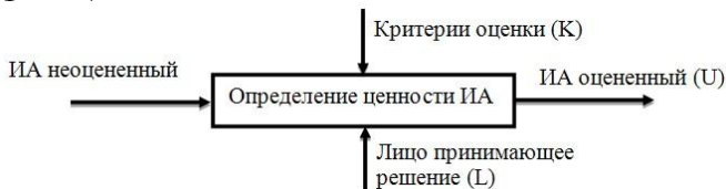
Рис. 1. Контекстная диаграмма определения ценности ИА

Рассмотрим контекстную диаграмму функциональной модели определения ценности ИА (рис. 1).