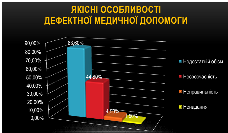
Рис. 2. Діаграма якісної структури недоліків медичної допомоги, яка надавалась лікарями терапевтичного фаху, стосовно загальної кількості «лікарських справ», в яких експертними комісіями були встановлені дефекти (n=67).

Аналіз допущених лікарями-терапевтами недоліків медичної допомоги за характером показав, що недостатній обсяг цієї допомоги виявлено у 83,6 % справ, несвоєчасність її надання – у 44,8 %, неправильність медичної допомоги констатована у 4,5 % випадків, ненадання медичної допомоги у вивчених матеріалах виявлено було лише один раз (рис. 2).