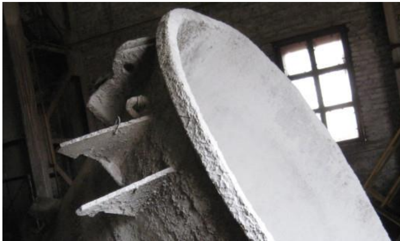
Рис. 3 – Фрагмент чаши с дополнительными рёбрами жесткости

Наиболее рациональным было бы применение рёбер жесткости из катаных заготовок, закрепленных на корпусе чаши методами сварки. Схема нагружения ребер в направлениях, противоположных утяжке, изменяет характер силового воздействия на корпус чаши при эксплуатации, что снижает её деформацию в несколько раз.