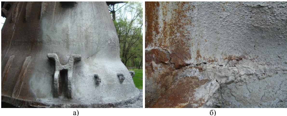
Рис.1 – Деформация чаши шлаковоза (а) и трещины в месте наибольших прогибов стенки корпуса (б)

Применяемые литые рёбра жесткости на чашах существующих конструкций выполняют свою функцию недостаточно эффективно. Во второй половине срока эксплуатации чаши прогибы стенки могут достигать 150-200 мм относительно первоначального профиля. Деформации корпуса такой величины приводят к затруднениям при удалении твёрдой фазы шлака из чаши. Вынужденные мероприятия технологического персонала по удалению коржевых остатков при опорожнении шлаковоза связаны с ударными нагрузками. Это уменьшает ресурс работы не только чаши, но и привода шлаковоза.