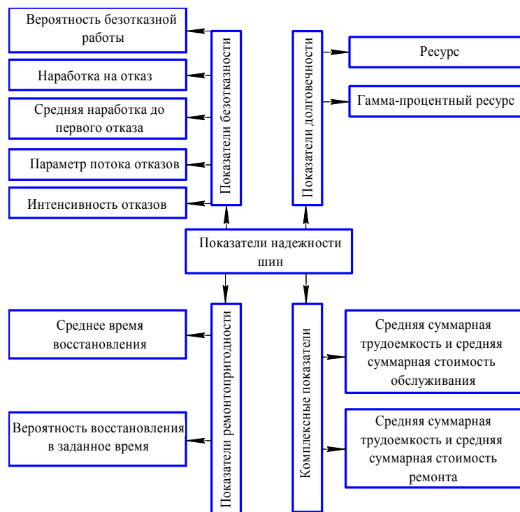
Рисунок 1 - Показатели надежности шин

надежности автомобильных шин рассматриваются необходимые конструктивно-технологические доработки, оценивается фактическая надежность и разрабатывается комплекс мероприятий по ее повышению. В сборе, обработке и анализе информации об отказах и неисправностях шин принимают участие автотранспортные предприятия (АТП), станции технического обслуживания (СТО), автомобильные заводы и высшие учебные заведения [3].