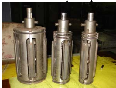
Рисунок 1-Інструмент для хонінгування з ріжучими брусками з штучних алмазів.

Для створення регулярного мікрорельєфу застосовувалось платовершинне хонінгування. При цьому завдяки оптимально підбраному співвідношенні зерен алмазів для хонінгувальних брусків (рис.1) та зв'язуючого матеріалу вдалося отримати високу точність отвору та забезпечити належний рельєф поверхні.