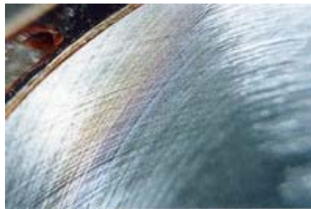
Рисунок 4 - Профіль поверхні після обробки.

Зразки, оброблені методом плосковершинного хонінгування, мали наступну поверхню: відносна опорна довжина профілю t_p - 50...70 % на рівні перетину профілю p = 1,0...1,5 мкм, середня глибина рисок - 2...5 мкм, ширина - 20... 60 мкм, шорсткість між ними (масляними кишнями) - 0,5... 1,0 мкм (9 ...10 клас), максимальна глибина рисок - до 7 мкм (рис.4).