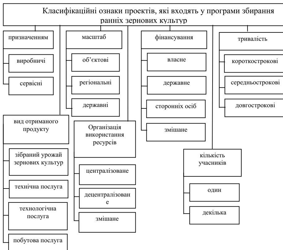
Рисунок 2 – Класифікація проектів, які входять до програм збирання ранніх зернових культур

Проекти, які входять до програми збирання зернових культур, мають зв'язки, які можна класифікувати за дванадцятьма класифікаційними ознаками (рис. 3).