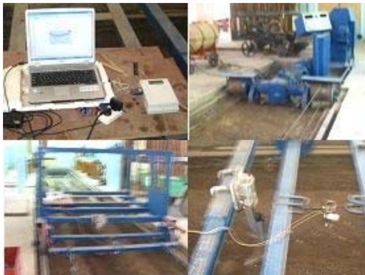
Рисунок 1 – Рабочая тележка с образцом сошника и измерительным оборудованием

Фиксирование сигналов, поступающих от датчика, реализуется с помощью специальной программы SuperTermV2.21 с частотой дискретизации 100 ms. Математическая обработка результатов измерений [9] и их графическое представление осуществляется с использованием программного обеспечения Microsoft Excel и MathCAD (рис. 2).