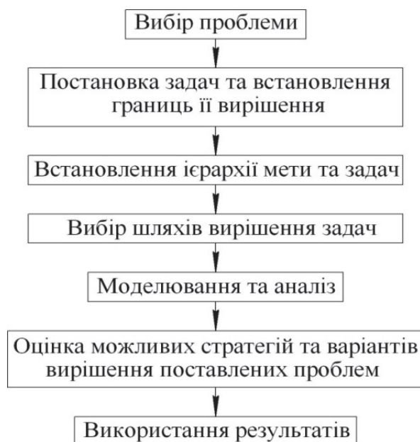
Рисунок 1 – Етапи системного аналізу та їх взаємозв'язок

Проблема, яку необхідно вирішувати в експлуатації МСГТ – це підвищення ефективності її використання (рис. 2). Постановка задач та встановлення границь її вирішення полягає у спрощенні проблеми для її практичного рішення, але при цьому зберігаються всі елементи, які створюють проблему. В даному випадку загальну проблему – підвищення ефективності використання МСГТ, можливо спростити до вирішення проблеми підвищення рівня її ТО. З однієї сторони, вона є найбільш складною та вартісною частиною експлуатації МСГТ, а з іншої сторони – експлуатація потребує підвищення мір безпеки при забезпеченні високої продуктивності та надійності.