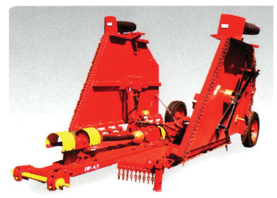
Рисунок 3 – Дисковий подрібнювач-розподілювач стебел сільськогосподарських рослин ПРН-4,5 "Поділля" підприємства ТОВ "Завод Красилівмаш" в транспортному положенні Джерело: [3]

Усі опорні колеса цієї машини обладнані гвинтовими механізмами для регулювання висоти скошування стебел рослин.