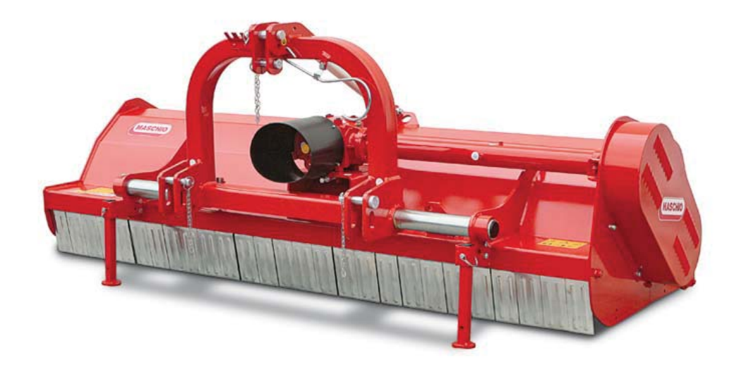
Рисунок 2 – Барабанний подрібнювач-розподілювач Тідге 300 фірми "Maschio" (Італія) Джерело: [2]

Робочими органами барабанних подрібнювачів-розподілювачів (рис. 2) є трубчастий вал з горизонтальною віссю обертання, до якого шарнірно закріплені ножі. Тобто він подібний до робочого органу косарки-подрібнювача КИР-1,5 і відрізняється тим, що він розміщений у циліндричному кожусі і тому подрібнені частинки стебел падають на ґрунт позаду машини [2].