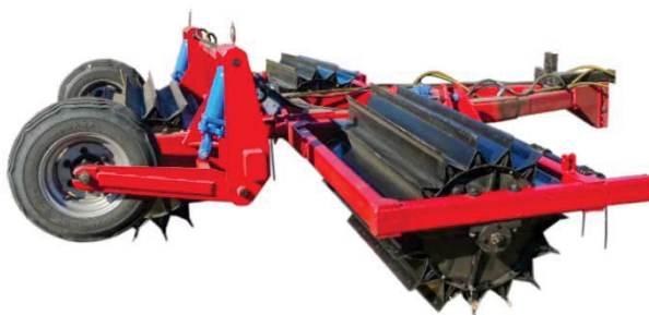
Рисунок 1 – Подрібнювач рослинних решток, розроблений науковцями кафедри сільськогосподарського машинобудування КНТУ

Викладення основних результатів. Експериментально визначений діапазон швидкостей від 15 до 24 км/год враховує особливості роботи котка-подрібнювача у польових умовах, а саме рух агрегата (рис. 1) на схилах-підйомах, як у вертикальній, так і у горизонтальній площині [4]. При таких значеннях швидкості руху доцільно враховувати силу опору повітря.