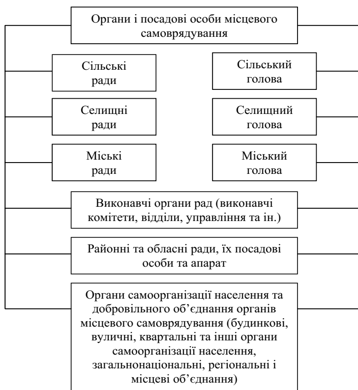
Рис. 2. Система органів місцевого самоврядування в Україні

У даний час не створено механізму по формуванню збалансованих центрального та місцевих бюджетів через нерівномірність розвитку територій, потреб їх дотування з держбюджету для вирішення нагальних, в першу чергу, соціальних питань. Так, в Кам'янець-Подільському районі Хмельницької області лише Гуменецька та Слобідко-Кульчичевецька сільські Ради є бездотаційними. До бюджету Устянської сільської Ради, наприклад, 2010 р. було залучено 270,8 тис. грн. надходжень, тоді як офіційних трансфертів від органів державного управління у вигляді дотацій вирівнювання надійшло 650,6 тис. грн., тобто майже 70%.