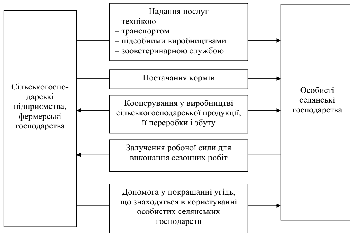
Рис. 2. Економічні відносини між сільськогосподарськими підприємствами, фермерськими господарствами та особистими селянськими господарствами

цивілізованих форм реалізації сільськогосподарської продукції, підвищення ефективності виробництва всіх учасників кооперації тощо. Створення нових організаційно-правових структур на базі особистих селянських господарств дасть останнім можливість знизити затрати живої праці на виробництво одиниці продукції, поліпшити умови праці і відпочинку селян, підвищити ефективність виробництва. Крім того, необхідно сприяти розвитку великих і дрібних форм сільськогосподарського виробництва в єдності. Вони повинні не протиставлятися, а взаємно доповнювати одна одну. Між особистими селянськими господарствами і сільськогосподарськими підприємствами та фермерськими господарствами повинні існувати тісні економічні відносини, які необхідно розвивати і використовувати з максимальною ефективністю (рис. 2).