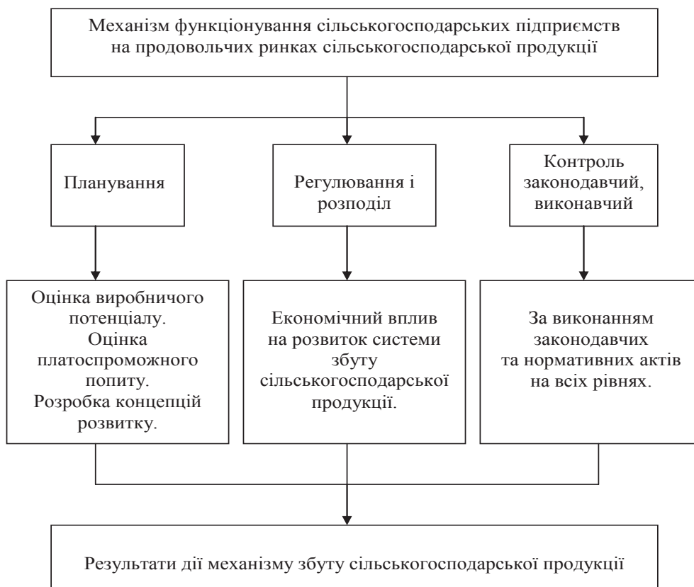
Рис. 1. Складові механізму ринку збуту сільськогосподарської продукції

Невід’ємною частиною консолідованого ринкового механізму є механізм ринку збуту сільськогосподарської продукції. При цьому в системі відносин, що складаються в процесі збуту сільгосппродукції, можна виділити три основні частини (підсистеми): планування (прогнозування), регулювання, контроль. Внутрішню структуру даного механізму можна, на наш погляд, виразити схемою (рис. 1).