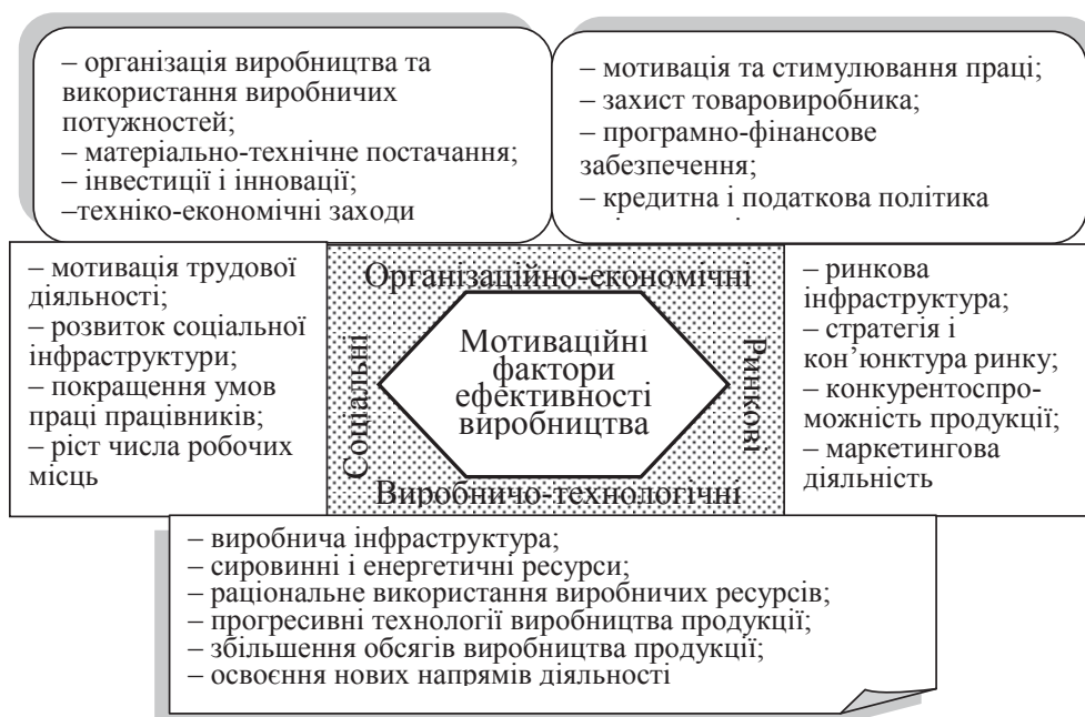
Рис. 1. Класифікаційна структура мотиваційних факторів ефективності виробництва

Як видно, ефективність є складною економічною категорією, в якій пов'язуються дії об'єктивних економічних законів і висвітлюється одна з важливих сторін – виробництво. Окрім цього, вона відображає широкий комплекс заходів, предметів праці, трудових, матеріальних та енергетичних ресурсів, економічних і соціальних факторів, які приймають участь в трудовій та виробничій діяльності. Тут же слід зазначити, що всі економічні фактори є залежними від людських мотивів, мотивацій та відповідних цим мотиваціям рішень, що реалізуються в організаційно-економічній поведінці працівників. Урахування факторів, які зумовлюють рівень ефективності сільськогосподарського виробництва, дає можливість реально оцінити наявні ресурси, розробити стратегію стійкого розвитку аграрних підприємств і визначити шляхи їх розвитку в ринкових умовах.